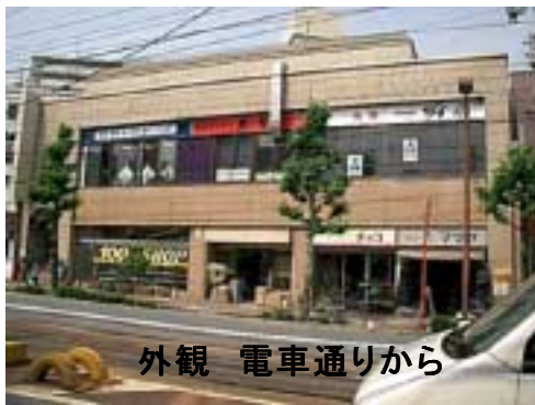
外観 電車通りから